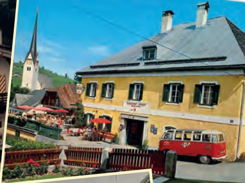
Hotel Post / Abtenau